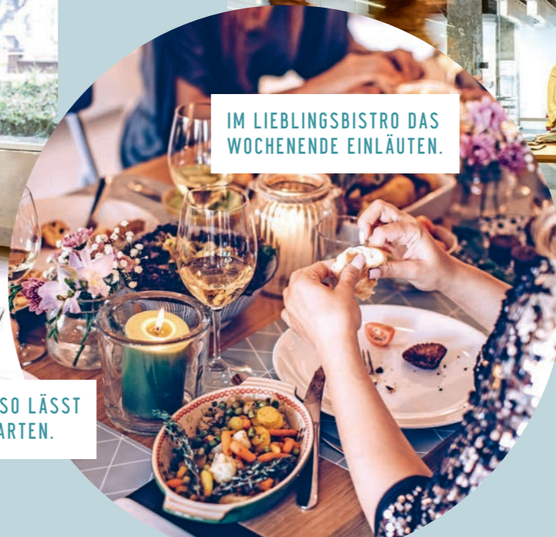
IM LIEBLINGSBISTRO DAS WOCHENENDE EINLÄUTEN.