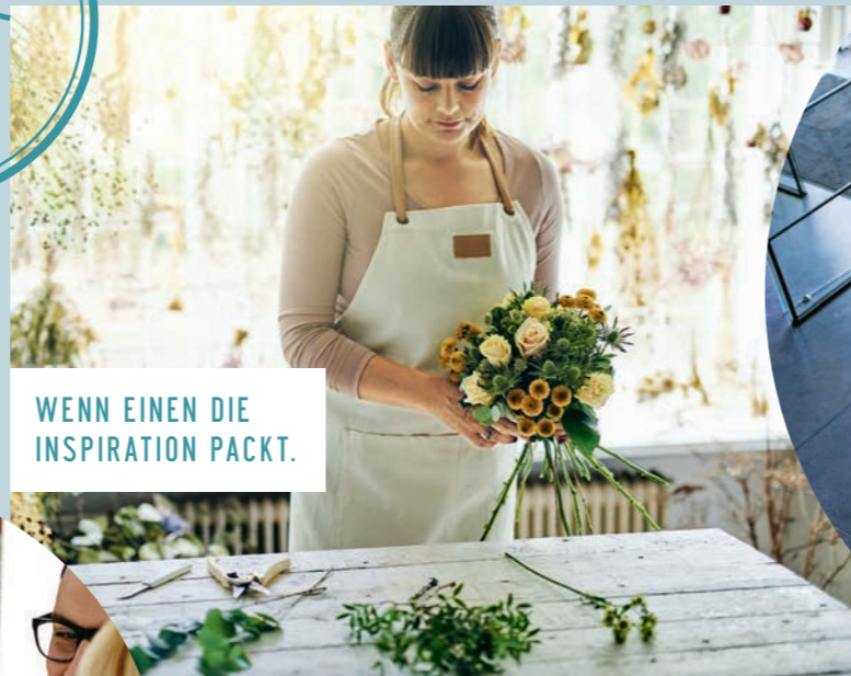
WENN EINEN DIE INSPIRATION PACKT.

Das Aussergewöhnliche am Löwengarten-Quartier ist die gelungene Kombination von Wohnen, Arbeiten, Einkaufen und Geniessen. Davon profitieren die künftigen Bewohnerinnen und Bewohner, aber auch das Gewerbe. Rund 5594 m 2 Fläche entlang der St. Gallerstrasse stehen für eine individuelle gewerbliche Nutzung zur Verfügung. Im Löwengarten-Quartier finden Gastronomen, Dienstleister, Ärzte oder Fachhändler attraktive Räumlichkeiten. Und die Kundenschaft befindet sich direkt im und ums Quartier. Nutzen Sie diese Chance!