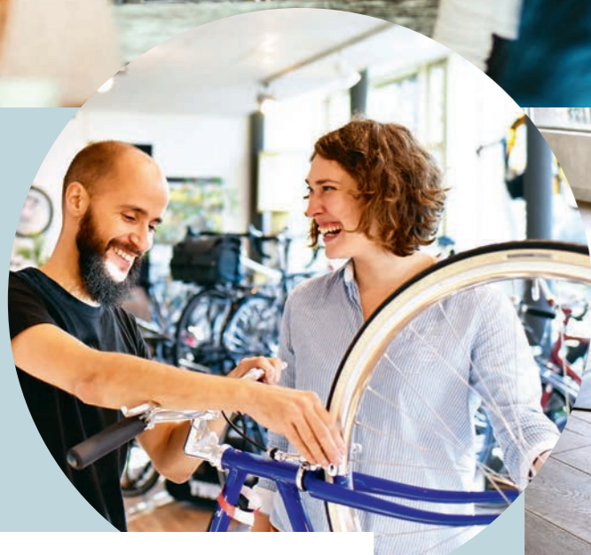
WIE PRAKTISCH, DEN VELOLADEN GLEICH VOR DER HAUSTÜR ZU HABEN.