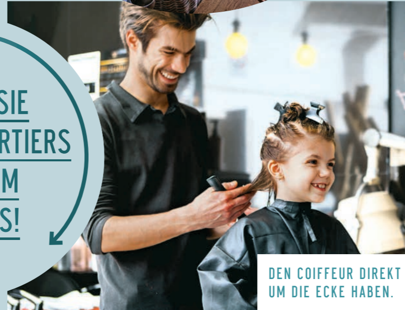
DEN COIFFEUR DIREKT UM DIE ECKE HABEN.

WERDEN SIE TEIL DES QUARTIERS MIT IHREM BUSINESS!